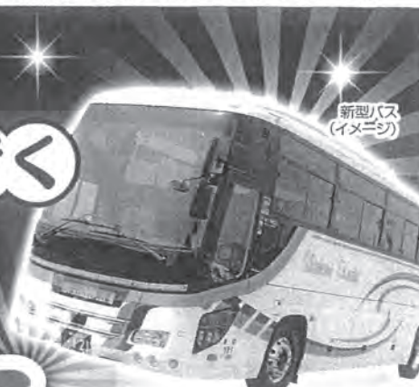
新型バス (イメージ)

※1日目:湯の花温泉 3名1室利用4,000円増 / 2名1室利用8,000円増 ※2日目:大阪ミナミは2名1室利用となります。