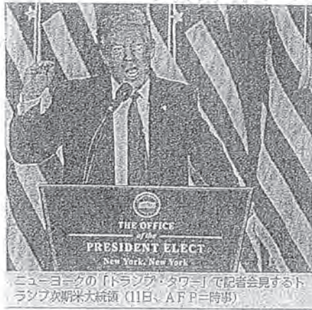
ニューヨークの「トランプ・タワー」で記者会見するトランプ次期米大統領（11日）

トランプ氏選挙後初会見 対日貿易赤字に不満 トランプ次期米大統領として、貿易不均衡の是正は11日（ニューヨーク）を課題に挙げた。トランプ氏はTPPから離脱し、考えて、対日貿易赤字の削減へ、輸出品目である農産物の市場開放を日本に迫ってくる可能性がある。▼3面に関連記事 トランプ氏は「米国はもはや良い取引をしていない。米国の貿易協定はひどい」と指摘。これまで批判してきた北米自由貿易協定（NAFTA）