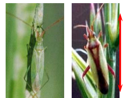
図 主な斑点米カメムシ類 左：アヒゲホリドリカスカメ 右：アスジカスカメ