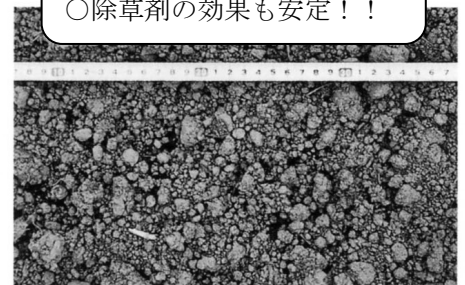
《砕土率 60% 以上の土壌》