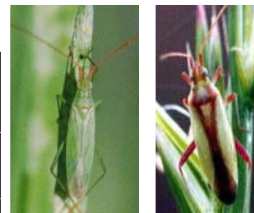
図 主な斑点米カメムシ類 左：アヒゲホリドリカスミカメ 右：アスジカスミカメ