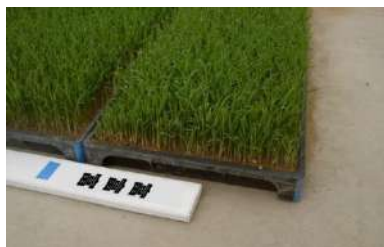
写真1: 品種名の表示