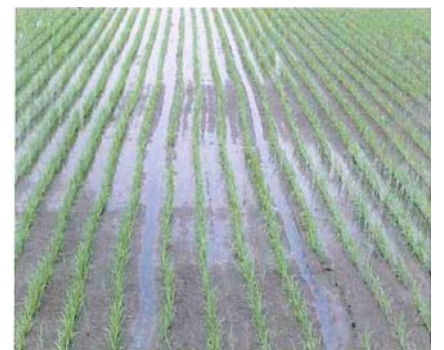
中干し開始時期の生育量