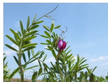
写真 カラスノエンドウの開花