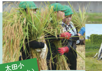
太田小 (新大正もち)