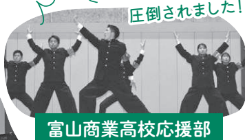
富山商業高校応援部