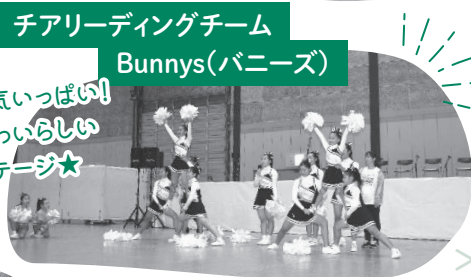
チアリーディングチーム Bunnys(バニーズ)