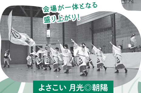
よさこい 月光◎朝陽