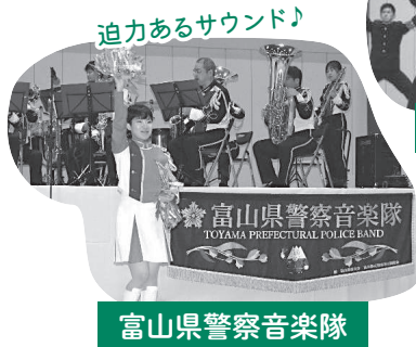
富山県警察音楽隊