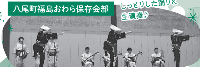
八尾町福島おわら保存会部