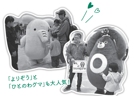
「よりぞう」と「ひとのわぐま」も大人気!