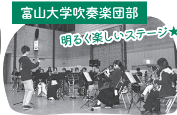
富山大学吹奏楽団部