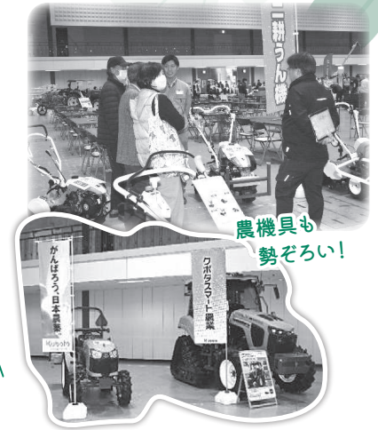
農機具も勢ぞろい!