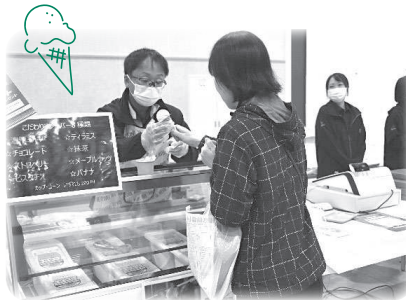
まんなか市場Instagramフォローで ジェラート1個プレゼント! フォローありがとうございます。