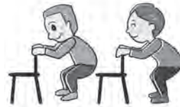
軽いしゃがみ立ち