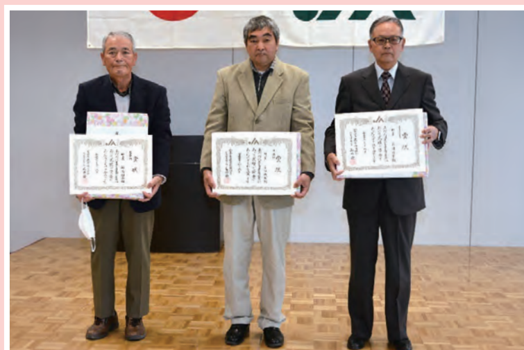
第57回 農産物品評会 組合長賞受賞者