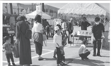
▲ 農協ブースで行ったドローン飛行では、初めて見る空飛ぶ機械に子どもたちは興味津々♪

自治振興会などが主催する地域のイベントに参加し、地元の方々とたくさん交流することができました。