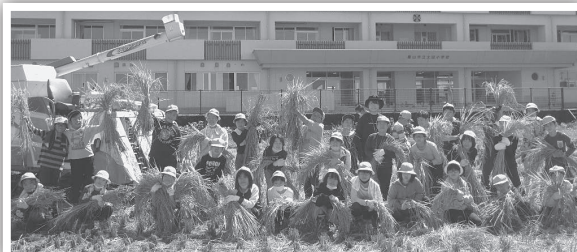
▲ 最初は使い慣れない鎌に悪戦苦闘！