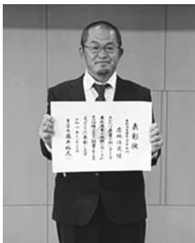
農林漁業優良生産部門 (園芸の部)