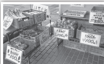
▲ 4地区で行った野菜販売はたくさんの方に来店いただき、たいへん好評でした！