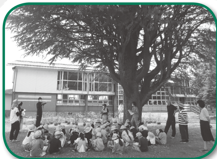
月岡小学校へ出前授業