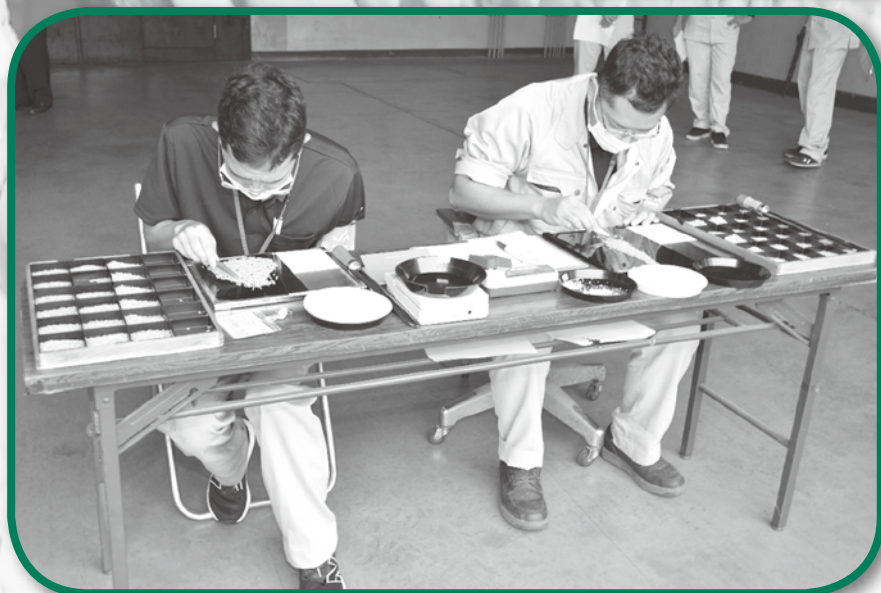
令和3年産米 初検査 (蜷川7号倉庫)