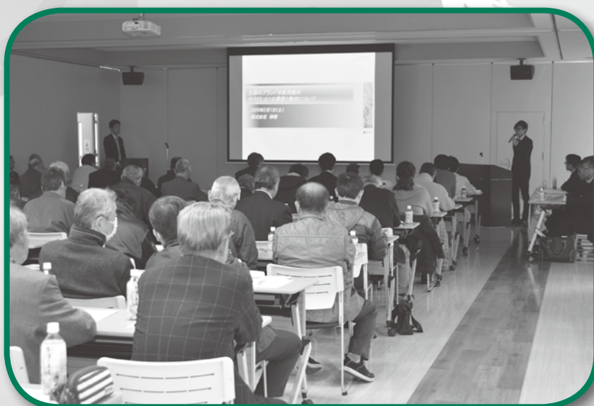
ゆうだい21 ブランド化推進大会