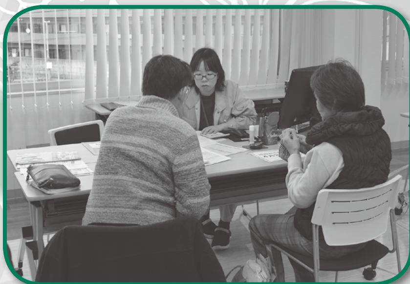
確定申告の相談 (中央支店)