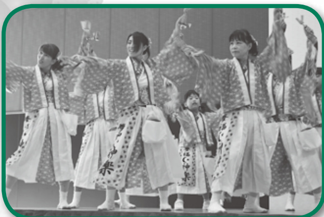
よさこいチーム ◀夢福神の皆さん