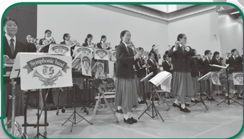
富山県立 富山商業高等学校 吹奏楽部の皆さん▶