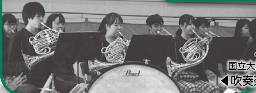
国立大学法人 富山大学 ◀吹奏楽団の皆さん