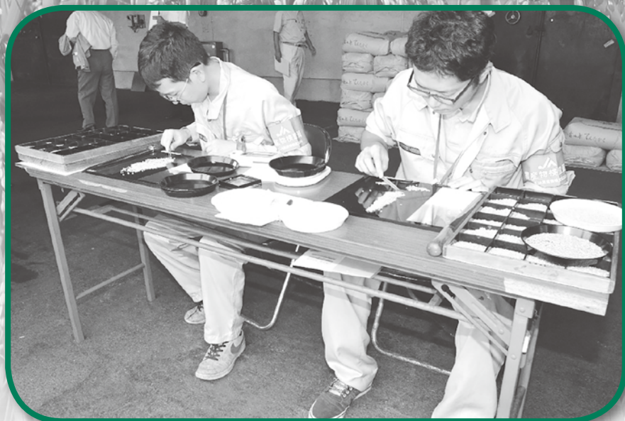
令和元年産米 初検査 (熊野25号倉庫)